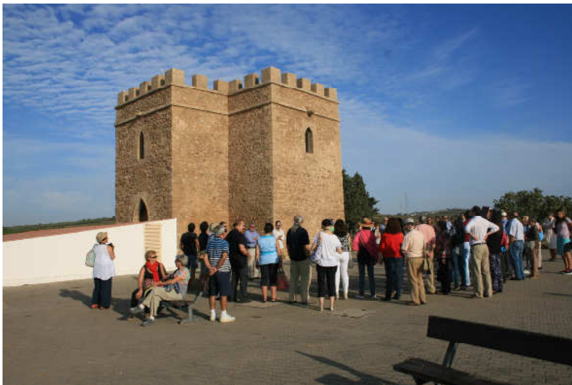
El grupo en La Torre de Doña Blanca, construida sobre el poblado fenicio.

Los distintos grupos venidos de las diferentes delegaciones (Barcelona, Valladolid, Córdoba, Madrid...) nos montamos en los autobuses y nos trasladamos hasta la Torre de Doña Blanca, en El Puerto de Santa María. Allí, bajo la privilegiada guía de uno de los miembros del equipo de excavación pudimos conocer este interesantísimo asentamiento fenicio en la bahía de Cádiz.