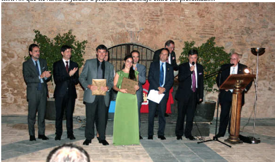
Los premiados con el Premio Paradores 2015